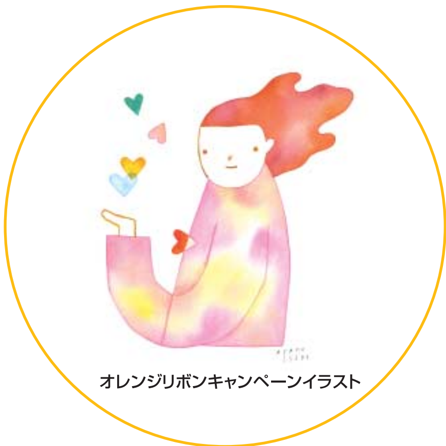
オレンジリボンキャンペーンイラスト